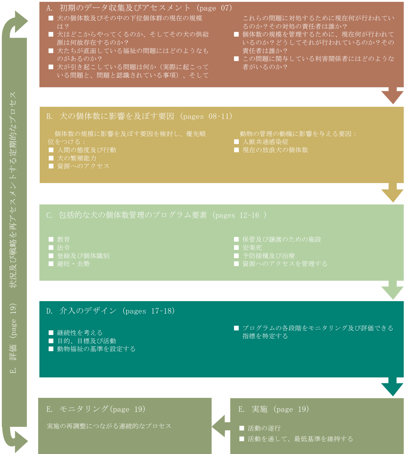
図2：プロセスの概要