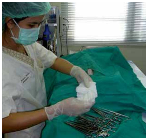
RAY BUTCHER/PHUKET ANIMAL WELFARE SOCIETY