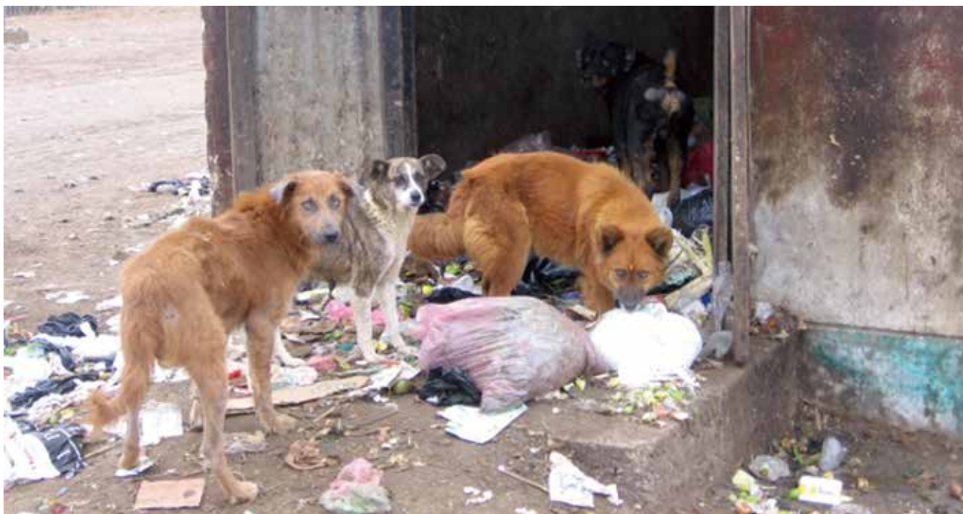
ゴミから餌を探しているペルーの放浪犬