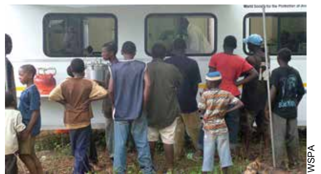
ザンジバルにおいて、移動式クリニックの窓をのぞき、避妊・去勢手術を見ている地域住民たち。

2006年、WSPAと地方自治体が避妊・去勢に関する介入をザンジバルにおいて実施したときに、似たようなことが起こった。介入初期は、コンプライアンスも低く、避妊・去勢するために動物を積極的に連れてくる飼い主は少なかった。しかし、数か月経つと、教育プログラム、鍵となる地域の代表者との話し合い、そして実際に避妊・去勢された動物の良好な健康状態の実例などが、人々の態度を変容し、人々が積極的に、避妊・去勢のために動物を連れてくるようになった。