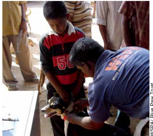
スリランカにおいて、狂犬病予防接種と寄生虫の治療を受けた犬に、個体識別のための赤い首輪をはめている様子