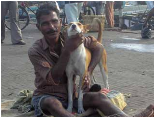
インドにおける、漁師と地域犬